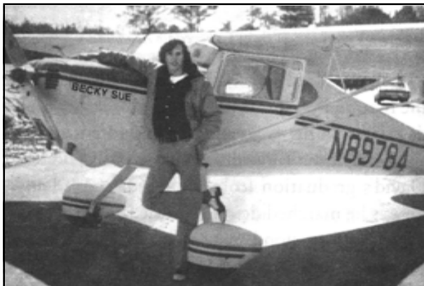
Самолетът “Беки Сю” Чесна 140.

„Съжалявам за катастрофирания самолет – пишеше тя. – Винаги съм искала да се науча да лети и се надявам да се науча на твоя