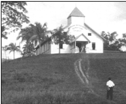
Църквата в Паруима.

Докато работата по изграждането на училището течеше, Дейвид продължаваше своята напрегната летателна програма.