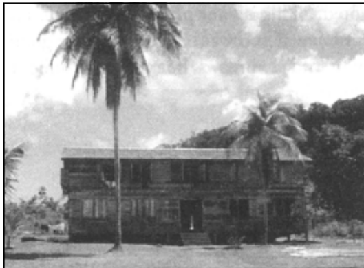
Първата нова сграда на дейвиското индианско училище.

имали тук училище от 30 години. Ако не искате да дадете вашата част, няма шанс да имаме вече училище“.