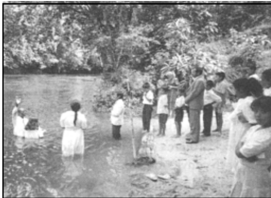
Кръщение в Кайкан.

– Пригответе я за вас. Надяваме се да я харесате.