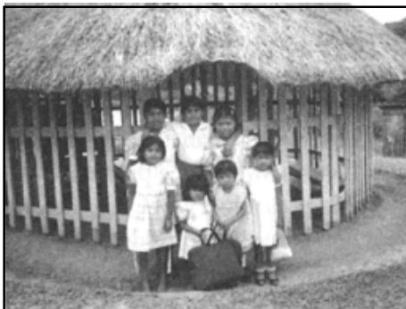
Кръгли сламени стаи за децата от Детското съботно училище.

Той избра 1 Царе 17 гл. за изследване сутринта и прочете за Елисей и вдовицата и за ежедневното подновяване на нейния запас от масло. Внезапно една мисъл завладя ума му: Дали като вдовицата съм преброил добре всичко, което имам? Но, Господи – започна да спори той, – нямам нужда от масло, имам нужда от пари в брой. Не можеше да отхвърли внушението, че трябва още веднъж да пресметне какво има. Няма смисъл – спореше той със себе си. – Вече знам какво имам, нали току-що ги изтеглих от банката. Но понеже това убеждение беше толкова силно, той реши да не му се съпротивлява. Щеше просто още веднъж да преброи парите и толкова. Чувстваше се странно. Отвори куфарчето и взе плика от банката. Изненада се, като