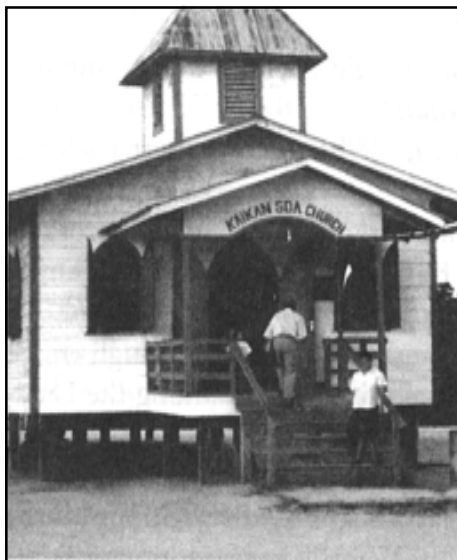
Адвентната църква край пистата в Кайкан.